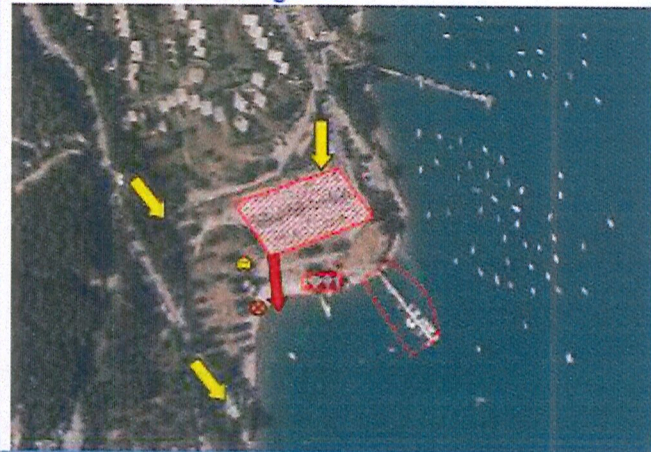
Schéma de la zone de baignade :