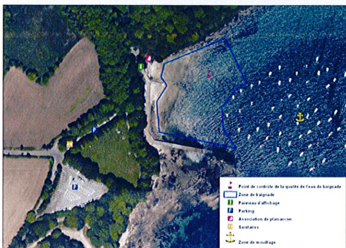
Carte de la zone de baignade

Saison balnéaire : du 15 juin au 15 septembre