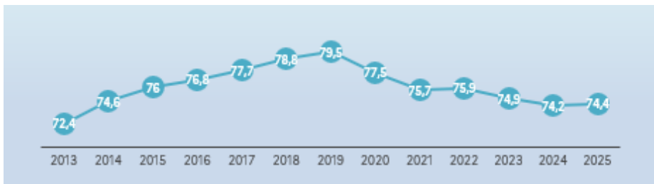
Proportion des eaux de baignade d'excellente qualité