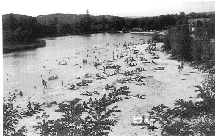
Photographie de la plage du plan d'eau des Salettes