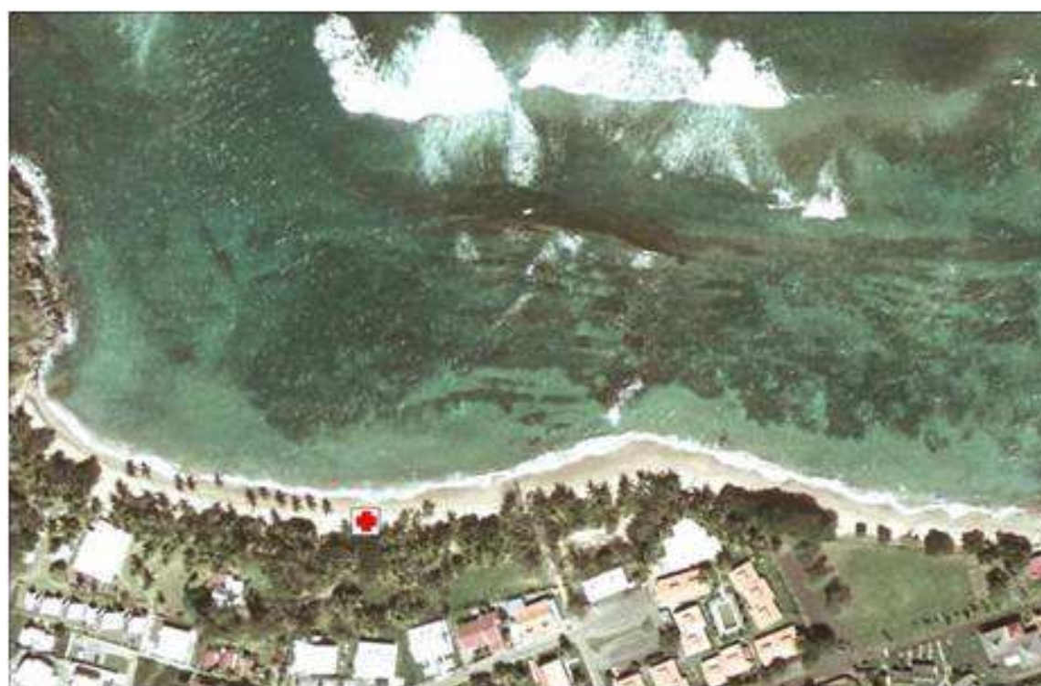
Photo de la zone de baignade

Fréquentation : environs 200 personnes en période de vacances scolaires